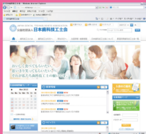
日技ホームページ

2005年（平成17年）、天皇后陛下御臨席のもと、創立50周年記念大会が盛大に開催されました。